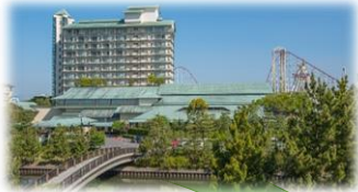
グレードアップ会席料理 (夏季イメージとなります)

※当日の仕入れ都合等により、やむを得ず一部お品を変更する場合がありますのでご了承ください。