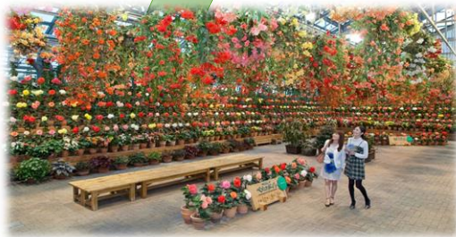
最大級規模の『ペゴニアガーデン』散策!