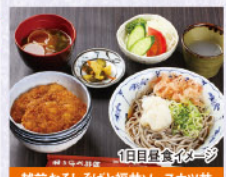
越前おろしそばと福井ソースカツ丼

2 目 ◎輪島朝市 日本三大朝市のひとつを自由散策 ◎穴水駅…「のと鉄道・観光列車「のと里山里海号」に 乗車)…能登中島駅 鉄道郵便車「オウ10」見学 ◎千里浜レストハウス 昼食:貝めし御膳 ◎ 千里浜なぎさドライブウェイ(日本で唯一の砂浜ロード) ◎(関19:00頃着) ◎各地