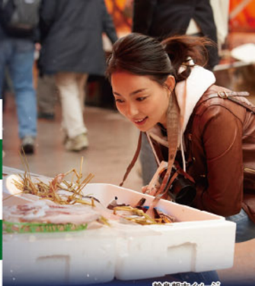
輪島朝市イメージ