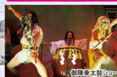
御陣乗太鼓ショー

飲み放題プラン (10名様以上 要別宴会場) 2,800円増 (夕食宴会時120分) 酒・ビール・焼酎(芋・麦)・ ウイスキー・ソフトドリンク 飲み放題