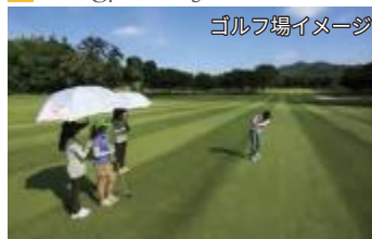
ゴルフ場イメージ