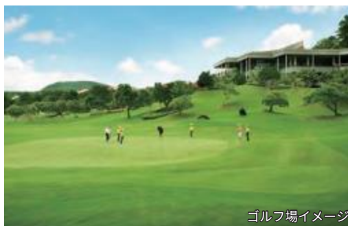
ゴルフ場イメージ