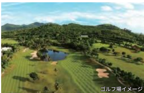
ゴルフ場イメージ