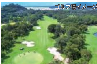
ゴルフ場イメージ

手付かずの森林と山々に囲まれた18ホール、7,393ヤード、パー72のチャンピオンシップ・ゴルフコース。手入れが行き届いたグリーンが、色鮮やかに広がっている。