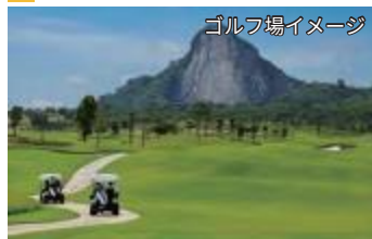
ゴルフ場イメージ