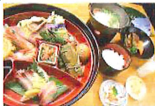
2日目夕食 和食イメージ