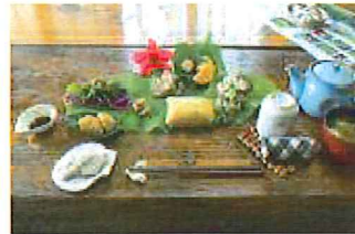
徳之島 昼食イメージ