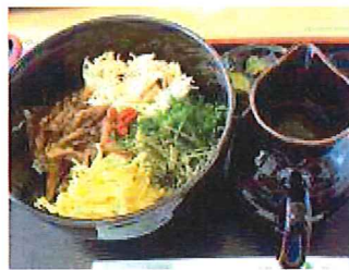
3日目昼食 鶏飯イメージ