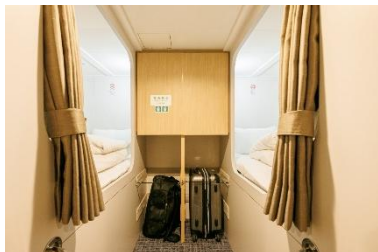
ツリストイメージ