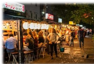
中洲屋台通りイメージ