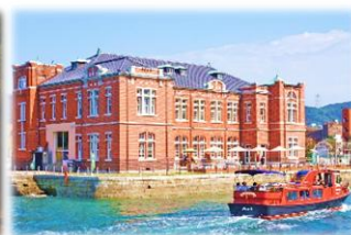
門司港レトロイメージ