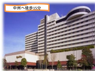
ホテルニューオータニ博多イメージ