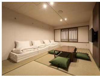
ファーストJイメージ