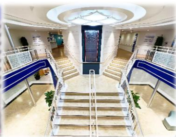
船内エントランスイメージ