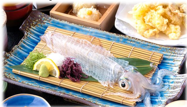
呼子名物イカの活け造りイメージ イカ造りは重さ(g数)での提供のため、お一人一杯とは限りません。予めご了承ください。

2026年 3泊4日 4月18日(土)出発 ご旅行代金(お一人様) 83,900円 (フェリー:ツリスト、ホテル:2～3名1室ご利用の場合)