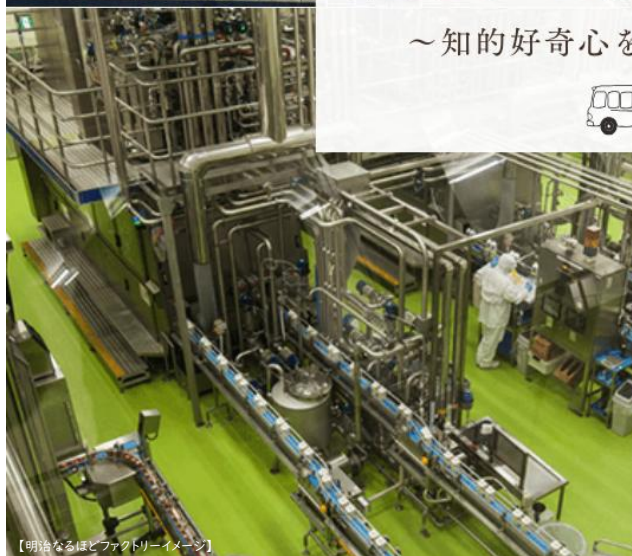
【明治なるほどファクトリーイメージ】