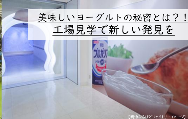
【明治なるほどファクトリーイメージ】